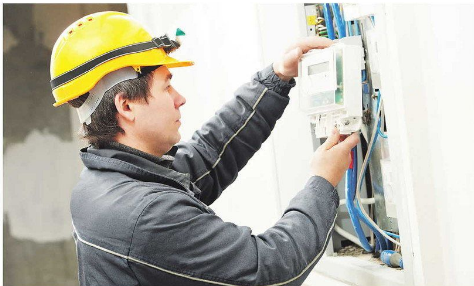
Zavádzanie smart home zariadení, teda spínačov, ovládačov či senzorov, je trendom v mnohých moderných domácnostiach.

Tieto dáta spracúvajú a fakturujú mesačne. Nepoužívajú sa tak už informácie určené náhradným spôsobom, ale reálne namerané. „Inteligentný elektromer totiž umožňuje automatický zber, spracovanie a prenos údajov. Vďaka nemu je možné sledovať spotrebu elektriny na hodinovej báze. To zas umožňuje dodávateľom ponúknuť variabilnú tarifikáciu, teda ceny, ktoré sa menia počas